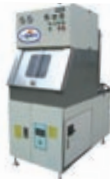
コンパクト & 省スペースを実現。