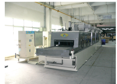
イオン水洗浄機 (コンベアシャワー式)

しかし、この電解水洗浄もオールマイティではありません。「洗浄」とは、汚れとり～乾燥までの工程を意味します。水系での欠点である乾燥性においては、弊社のエアブロー及び乾燥ノウハウによって日々改善、性能向上を行なっています。弊社は洗浄機総合メーカーとして様々な洗浄装置を製造しており、お客様の被洗浄物に合わせて洗浄方法を選定いたします。